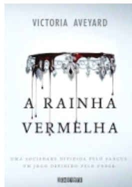
Autora: Victoria Aveyard