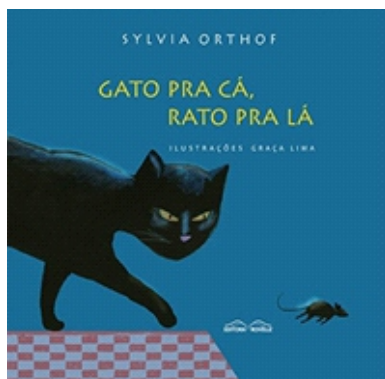
Autora: Sylvia Orthof Editora: Rovellet