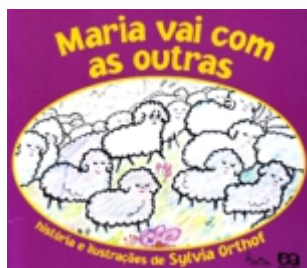
Autora: Sylvia Orthof Editora: ÁTICA