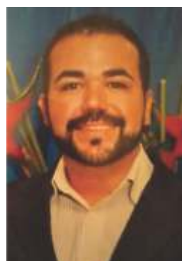
Prof. Cunha Felipe Curcino Ensinos Fundamental 1 e 2

Essa obra é uma das comédias mais conhecidas de William Shakespeare. Trata-se de uma peça que conta a história de Catarina, uma jovem de temperamento forte que demonstra aversão ao casamento e procura fugir a todo instante da submissão aos homens.